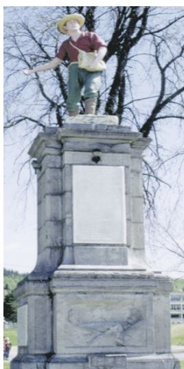
Monument des Vingt et un - érigé en 1924

Endommagé, mais malgré tout épargné par les eaux lors des inondations de 1996, le Musée du Fjord a profité de cette période d'adversité pour faire peau neuve et renaître dans des espaces agrandis et complètement rénovés. Avec une plus grande surface d'exposition, des équipements améliorés et une équipe plus déterminée que jamais à servir sa communauté, le Musée vous souhaite une cordiale « Bienvenue à tous ! »